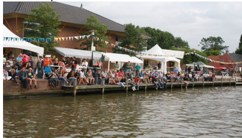
Gezellige drukte bij het dorpshuis te Onderdendam

'Gemeenten, Provincie en het Rijk kunnen door te investeren op het platteland deze krimp beperken. De kleinere dorpen hebben ook behoefte aan een dorpshuis. Een dorpshuis is niets anders dan een multifunctioneel gebouw/centrum waar tal van activiteiten kunnen plaatsvinden die zichzelf niet financieel kunnen bedruipen. U moet dan denken aan cursussen, een kleine bibliotheek, een toneelvereniging, een biljart- of kaart vereniging, feesten en partijen, een filmavond en soms zelfs kinderdagopvang of een bankfiliaal. Ook streekmusea kunnen exposities houden in het dorpshuis. Met veel vrijwilligers, subsidie en een actief bestuur is een dorpshuis van grote toegevoegde waarde voor een klein dorp'.