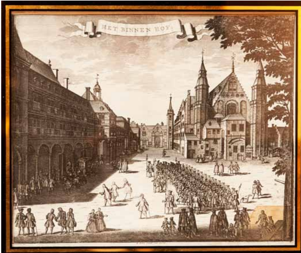
Het Binnenhof, gravure uit de 18 e eeuw