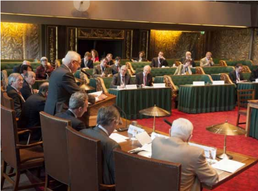
Symposium Europees Veiligheidsbeleid 16 mei 2012