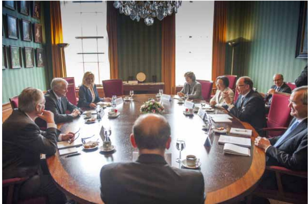
Ontvangst Voorzitter Duitse Bondsraad 6 juni 2012