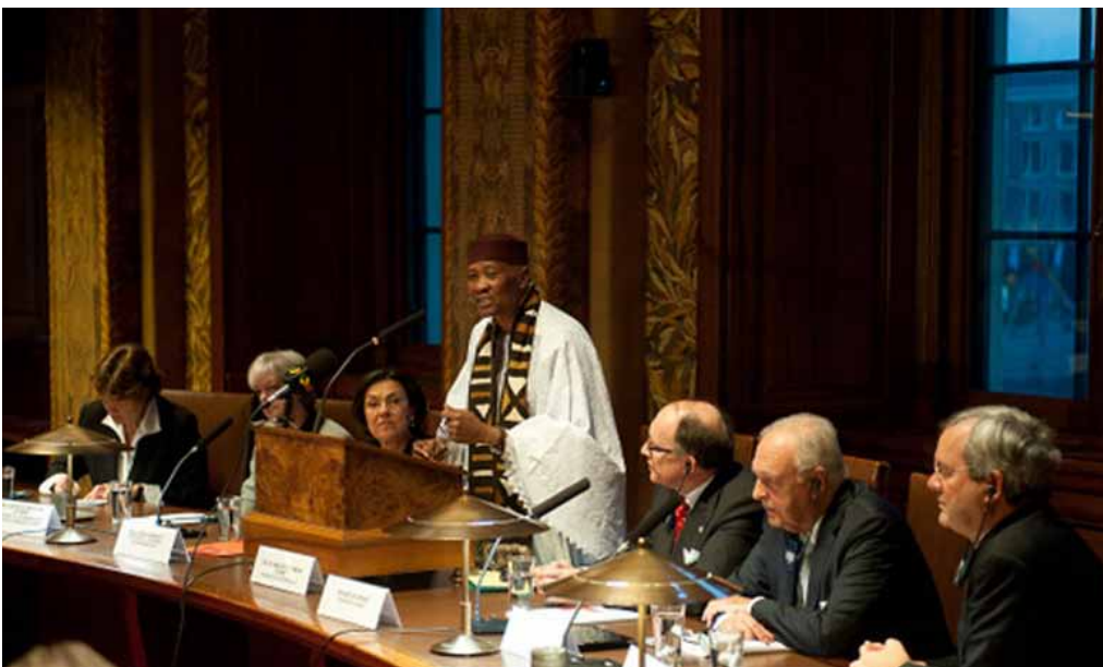
Ontvangst president van Mali 29 november 2011

Op 29 november 2011 sprak de toenmalig president van Mali, de heer Amadou Toumani Touré, in de plenaire zaal met de Voorzitter van de Eerste Kamer en met leden van de commissie voor Buitenlandse Zaken, Defensie en Ontwikkelingssamenwerking. De ontmoeting vond plaats in het kader van een driedaags officieel bezoek aan Nederland. De heer Touré gaf in de Eerste Kamer een uiteenzetting over de maatschappelijke ontwikkelingen in zijn land, gevolgd door een gedachtewisseling met de aanwezige Kamerleden. In de discussie werd gewag gemaakt van de gezamenlijke zorgen van beide landen over de negatieve spillover effecten van de onrust in Libië en de proliferatie van wapens in de Sahel-regio.