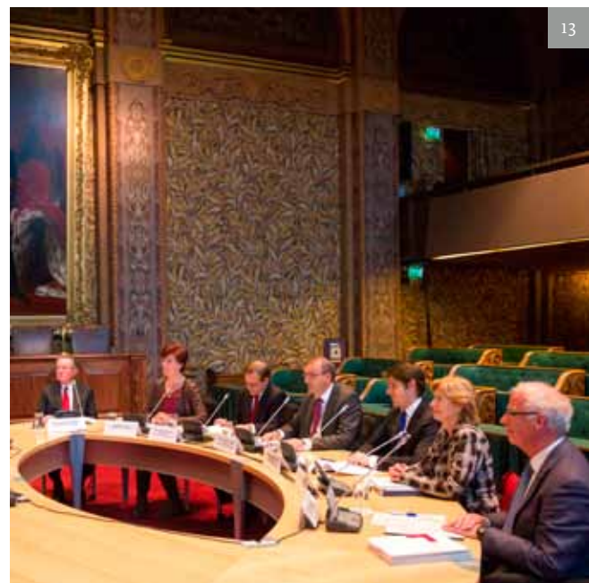
De Parlementaire Onderzoekscommissie bij de openbare gesprekken