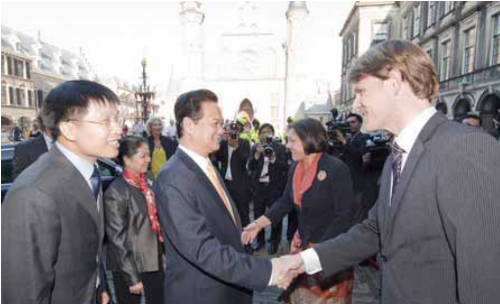
Ontvangst minister-president van Vietnam 28 september 2011

Naast het bezoek van de minister-president brachten de leden van de commissie voor Sociale Zaken van de Nationale Assemblée van de Socialistische Republiek Vietnam en vertegenwoordigers van het Vietnamese ministerie van Sociale Zaken op 3 april 2012 een werkbezoek aan de Eerste Kamer. De delegatie was in Nederland om een beeld te krijgen van het Nederlandse wetgevingsproces en meer in het bijzonder van de wetgeving op het gebied van huwelijks- en familierecht en op het gebied van werkgelegenheid en sociale zekerheid. De commissies voor Sociale Zaken en Werkgelegenheid en voor Veiligheid en Justitie wisselden met hun gasten van gedachten over deze onderwerpen.