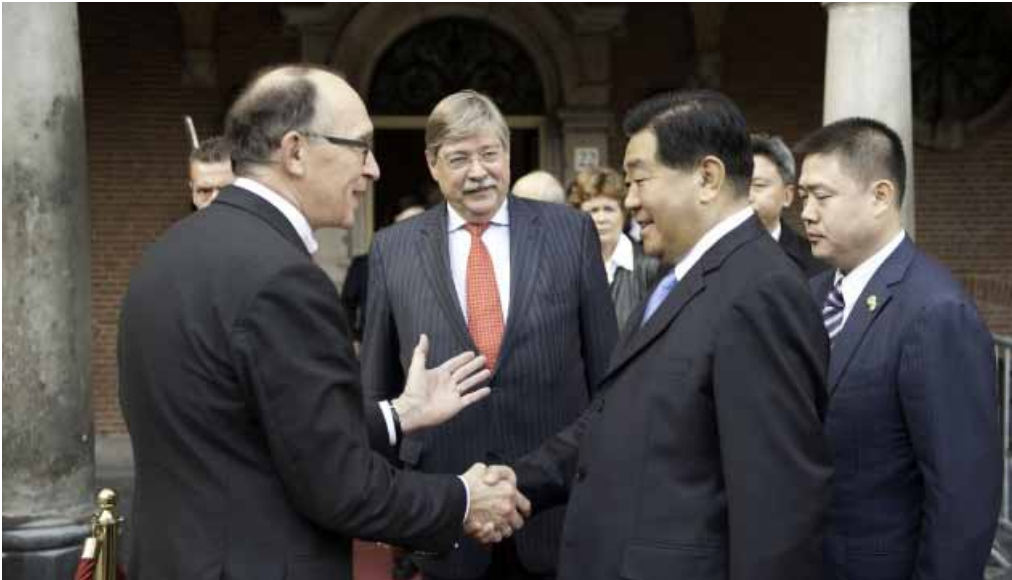
Ontvangst Voorzitter van het Staand Comité van het Nationale Volkscongres in de Volksrepubliek China 16 mei 2012

Een aantal maanden voorafgaand aan het bezoek van de heer Wu, op 27 oktober 2011, ontvingen de Staten-Generaal reeds de heer Jia Qinglin, voorzitter van de National Committee of the Chinese People's Political Consultative Conference . De heer Jia Qinglin werd vergezeld door enkele leden van de Chinese volksvertegenwoordiging en enkele topambtenaren van de Chinese regering. In een gesprek met Kamerleden sprak de heer Jia onder andere de Chinese bereidheid uit om bij te dragen aan de financiële stabiliteit van de eurozone en wees hij op de voorgenomen Chinese miljardeninvestering in de realisering van uiteenlopende watergerelateerde projecten.