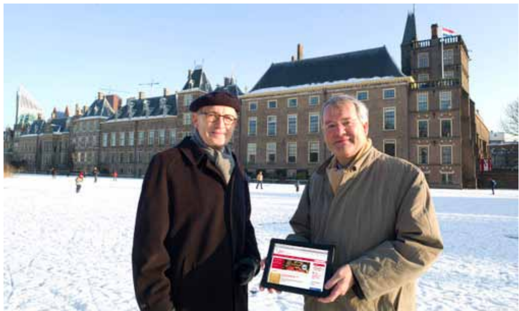
Lancering vernieuwde website 7 februari 2012

De Eerste Kamer is in het afgelopen parlementaire jaar geheel overgestapt naar een digitale vergadervoorziening. Met de introductie van de Eerste Kamer App hebben de Senatoren de mogelijkheid om via een iPad de vergaderstukken en -convocaten te ontvangen. Dit geldt voor zowel de commissievergaderingen als de plenaire vergadering. Ook is het mogelijk vanuit deze vergaderstukken door te linken naar het betreffende Kamerstukdossier. Hiermee kunnen de Senatoren snel en effectief worden voorzien van informatie die voor hen noodzakelijk is om de vergaderingen goed voor te bereiden.