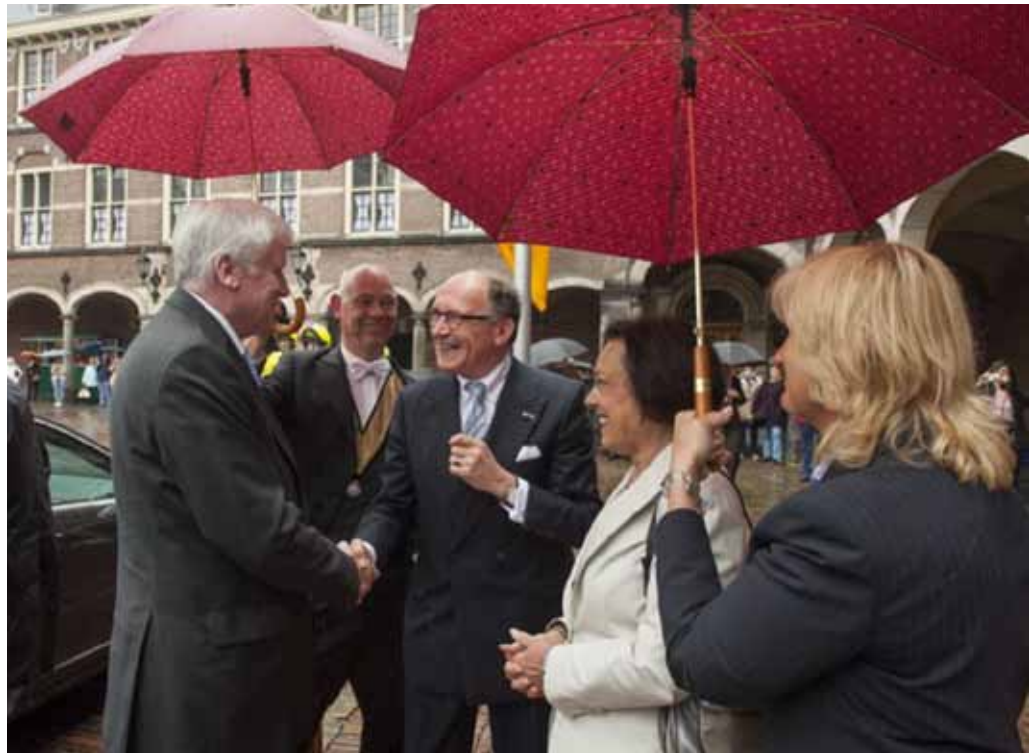
Ontvangst Voorzitter Duitse Bondsraad 6 juni 2012

In dit kader ontving de Eerste Kamer ook dit vergaderjaar weer verschillende buitenlandse delegaties. Veel van deze ontmoetingen zijn gezamenlijk met de Tweede Kamer georganiseerd. Naast ontmoetingen met een aantal buitenlandse Senaatsvoorzitters en ontmoetingen met een multilateraal karakter, ontving de Eerste Kamer ook vertegenwoordigers van de uitvoerende macht. Daarnaast bestond er in het afgelopen parlementaire jaar bijzondere aandacht voor ontwikkelingen in interparlementaire Assemblees en interparlementaire conferenties in EU-verband. Hierna volgt een selectie van een aantal in het oog springende internationale ontmoetingen.