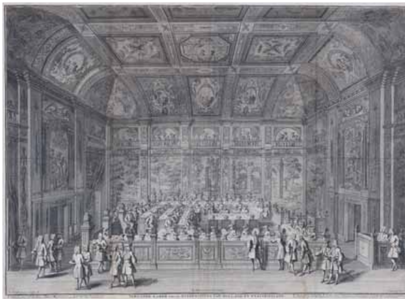
‘Vergader-Kamer van de Heeren Staten van Holland en Westvriesland’ Gravure uit 1730

Tijdens de plenaire behandeling van het wetsvoorstel op 5 juni 2012 bleek dat de Kamer een aantal bezwaren had tegen het geheel laten vervallen van het nationaliteitsvereiste. Allereerst is de Kamer principieel tegen het fenomeen van de ‘nationale kop’ bij implementatiewetgeving. Het Europees Hof oordeelde dat het nationaliteitsvereiste volgens het Europese recht niet mag gelden voor burgers uit EU-landen, maar wel voor burgers uit andere dan EU-landen. Het openstellen van het ambt voor burgers wereldwijd – de nationale kop – acht de Kamer bezwaarlijk. Ook voelde de Kamer weinig voor het openstellen van het ambt van notaris voor alle denkbare nationaliteiten wanneer er geen sprake is van wederkerigheid. De regering zegde vervolgens een wetswijziging toe met de strekking dat het nationaliteitsvereiste wordt vervangen door de eis van Unieburgerschap (inclusief het burgerschap van de EER-landen), en dat het wetsvoorstel pas in werking treedt als de bedoelde wetswijziging door de Kamers is aanvaard.