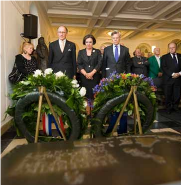
Herdenking oorlogsslachtoffers Nederlands-Indië 14 augustus 2012

In het afgelopen parlementaire jaar heeft de Voorzitter van de Eerste Kamer verscheidene malen de Kamer vertegenwoordigd bij herdenkingen voor slachtoffers van oorlogsgeweld. De Voorzitter was onder meer aanwezig bij de herdenking van de oorlogsslachtoffers in voormalig Nederlands-Indië , de '4 mei herdenking' in het gebouw van de Tweede Kamer en de Nationale Dodenherdenking in Amsterdam. De eerste Ondervoorzitter van de Eerste Kamer heeft bij de herdenking van de slachtoffers van detentie in het Oranjehotel Scheveningen namens de Staten-Generaal een krans gelegd.