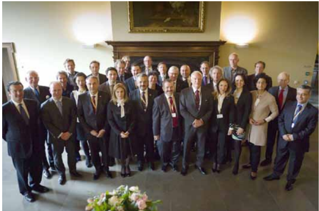
Groepsportret Turkse delegatie, Eerste Kamerleden en Tweede Kamerleden 17 april 2012

In 2012 vieren Nederland en Turkije 400 jaar diplomatieke betrekkingen. Een staatsbezoek van de Turkse president, de heer Abdullah Gül, aan Nederland was de culminatie van verschillende culturele evenementen en activiteiten die in dit kader in Turkije en Nederland plaatsvonden. De heer Gül werd op 18 april 2012 ontvangen in de Eerste Kamer door de Voorzitters van de beide Kamers der Staten-Generaal. Tijdens het bezoek ging de president in gesprek met verschillende Kamerleden, onder andere over de betrekkingen tussen Turkije en Europa, de situatie in Syrië en de eventuele rol van de Verenigde Naties en de NAVO in dat conflict. In voorbereiding op dit staatsbezoek ontvingen leden van de commissies voor Buitenlandse Zaken, Defensie en Ontwikkelingssamenwerking en voor Europese Samenwerkingsorganisaties op 17 april 2012 een delegatie van Turkse parlementsleden voor een werklunch. De gesprekspartners bediscussieerden daarbij recente ontwikkelingen in Turkije, Nederland en Europa.