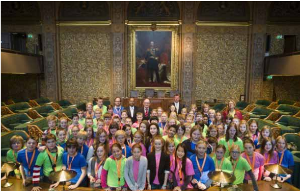
Finale Debat Derde Kamer 11 november 2011

Om haar taken op een goede wijze te kunnen vervullen, zoekt en onderhoudt de Eerste Kamer contacten met bijvoorbeeld bestuurlijke en maatschappelijke organisaties en deskundigen. Zo zijn in het afgelopen parlementaire jaar deskundigen geconsulteerd en hebben vertegenwoordigers van verschillende provincies een bezoek gebracht aan de Eerste Kamer. Voorts bieden de Eerste Kamer en de Tweede Kamer middels het initiatief ' De Derde Kamer ' scholen een lesprogramma aan en biedt de Eerste Kamer studenten en pas afgestudeerden stageplaatsen aan. Bovendien heeft de Kamer twee websites, waarop belangstellenden kennis kunnen nemen van de activiteiten van de Eerste Kamer. Tot slot is op uitnodiging van de Voorzitter van de Eerste Kamer de Verenigde Vergadering op Prinsjesdag op 20 september 2011 – net als in het voorgaande jaar – bijgewoond door vierentwintig vrijwilligers afkomstig uit alle provincies. Hiermee heeft de volksvertegenwoordiging blijk gegeven van haar waardering voor het werk van de vele tienduizenden vrijwilligers in Nederland, die actief zijn bij maatschappelijke en ideële organisaties.