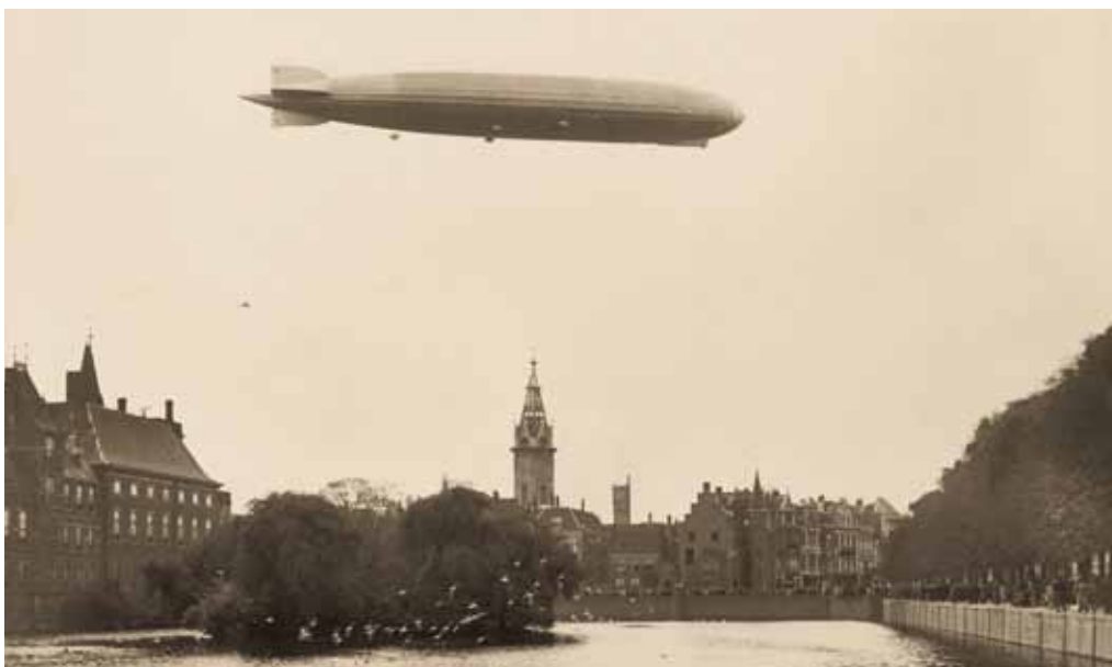
Zeppelin boven Hofvijver 13 oktober 1929

Onder andere het verloop van het wetgevingsproces bij het wetsvoorstel over het elektronisch patiëntendossier vormde voor de Eerste Kamer aanleiding om het vooruitlopen op wetgeving in algemene zin aan de orde te stellen. De Voorzitter heeft op verzoek van de commissie voor Financiën op 19 juni 2012 hierover een brief 23 gestuurd aan de minister-president. De laatste keer dat de Eerste Kamer de kwestie van vooruitlopen op wetgeving in algemene zin onder de aandacht bracht, was in september 2008 . De discussie spitste zich destijds toe op de wijze waarop de regering in de media een beeld neerzette alsof een wet reeds een feit was, terwijl de Eerste Kamer het wetsvoorstel nog moest goedkeuren. Dit keer vroeg de Kamer de regering aan te geven in welke gevallen ze van plan is vooruit te lopen op wetgeving. De Kamer heeft aangegeven daarbij graag de klemmende redenen voor het vooruitlopen op wetgeving te ontvangen, alsmede een planning. Tot slot heeft de Kamer aangegeven dat zij het door haar voorgestane uitgangspunt – niet vooruitlopen op wetgeving – alsmede de voorstellen voor informatievoorziening aan de Kamer, graag opgenomen ziet in het Draaiboek voor de regelgeving en de Aanwijzingen voor de regelgeving. 24