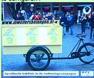
Campagnefiets Mooi Utrecht

Mooi Utrecht wist 7 maart een zetel te veroveren in de Provinciale Staten. Mooi Utrecht is geen traditionele partij, maar wil een platform zijn voor alle lokale partijen binnen de provincie Utrecht. Twaalf lokale partijen uit elf verschillende woonplaatsen in tien verschillende gemeenten hadden samen een lijst gevormd waarmee een alternatief werd geboden voor de gevestigde politiek in het Utrechtse provinciale bestuur. De partij wil een platform zijn voor tijdige en voldoende inspraak vanuit de lokale bevolking. 'De provincie richt zich vooral op B en W-college's en de ambtelijke organisaties van gemeenten, gemeenteraden worden - zo dit al plaatsvindt - pas in een laat stadium bij het provinciaal beleid betrokken'. Tot nog toe ontbrak het de lokale partijen aan de mogelijkheid om dit via een eigen stem binnen de staten te corrigeren'.