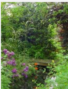
Mooi in Brabant

Ondernemingen vertrekken naar nieuwe bedrijventerreinen terwijl andere ondernemingen daar achter blijven. Vaak verloedert een dergelijk bedrijventerrein waardoor nog meer ondernemingen wegtrekken. Het resultaat is dat er steeds nieuwe bedrijventerreinen moeten worden ontwikkeld terwijl de gemeenschap opdraait voor de kosten van wat deftig heet de revitalisatie (opknappen) van oude bedrijventerreinen. Op zich is het begrijpelijk dat ondernemingen naar nieuwe bedrijventerreinen willen. Dat is goedkoper voor hen. Het opknappen van oude bedrijventerreinen kost echter de overheid veel geld. Het gevolg is ook dat er door de ontwikkeling van het nieuwe bedrijventerrein volstrekt onnodig weer een stuk open ruimte wordt volgebouwd.