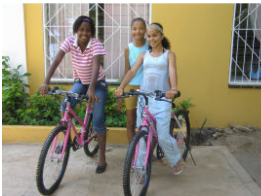
Jongeren Huize St. Jozef met nieuwe fietsen