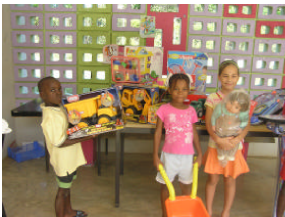
Kinderen Huize St. Jozef met nieuw speelgoed

De toekenning van het geld is voornamelijk besteed aan het opknappen van het gebouw en de brandbeveiliging (65.7%). Hiernaast is met 15.9% van de middelen de buitenspeelplaats opgeknapt.