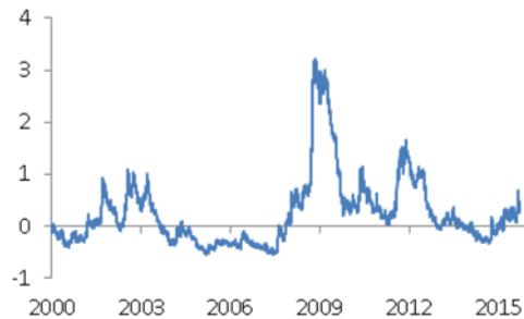
Figuur 1 – Indicator van financiële stress (DNB stress-index) 1

De markt is momenteel voldoende stabiel voor een transactie. Er is daarmee voldaan aan de randvoorwaarde van een stabiele financiële sector.