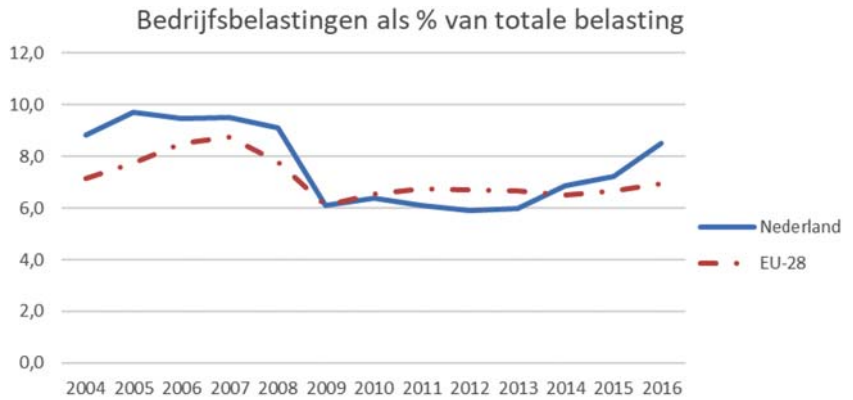
Figuur 2: Bedrijfsbelastingen als percentage van de totale belasting 1

1 Europese Commissie, Data on Taxation, https://ec.europa.eu/taxation_customs/business/economic-analysis-taxation/data-taxation_en