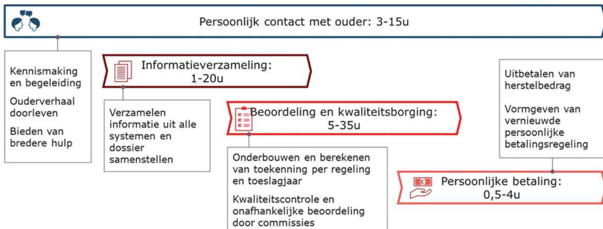
Figuur 3: Indicatie behandeltime per ouder voor herstelactiviteiten

Mijn belangrijkste conclusie uit figuur 3 is dat – na toepassing van de gekozen versnellingsoptie, optie 4 – verdere versnelling in het proces niet mogelijk is zonder afbreuk te doen aan de centrale uitgangspunten van de hersteloperatie. De voornaamste tijdsbesteding in het herstelproces zit namelijk in het individuele contact en maatwerk richting ouders inclusief het indien nodig helpen van ouders met aanvullende hulpvragen bij derden (~15-20%), in het verzamelen van informatie om de situatie van de ouders in kaart te brengen en het verhaal van de ouder te bevestigen (~30%), in het waarborgen van de consistentie en zorgvuldigheid van de beoordeling, zeker bij zaken waarin de ouder op basis van de regelingen geen (volledig) herstel kan krijgen (~40%), en in het vormgeven van een