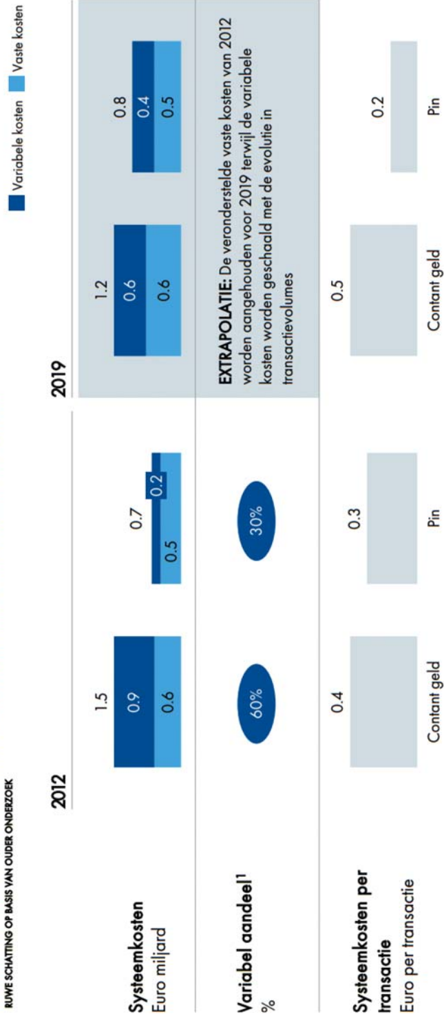
Figuur 6 Evolutie van de systeemkosten van het betaalverkeer in Nederland RUWE SCHATTING OP BASIS VAN OUDER ONDERZOEK