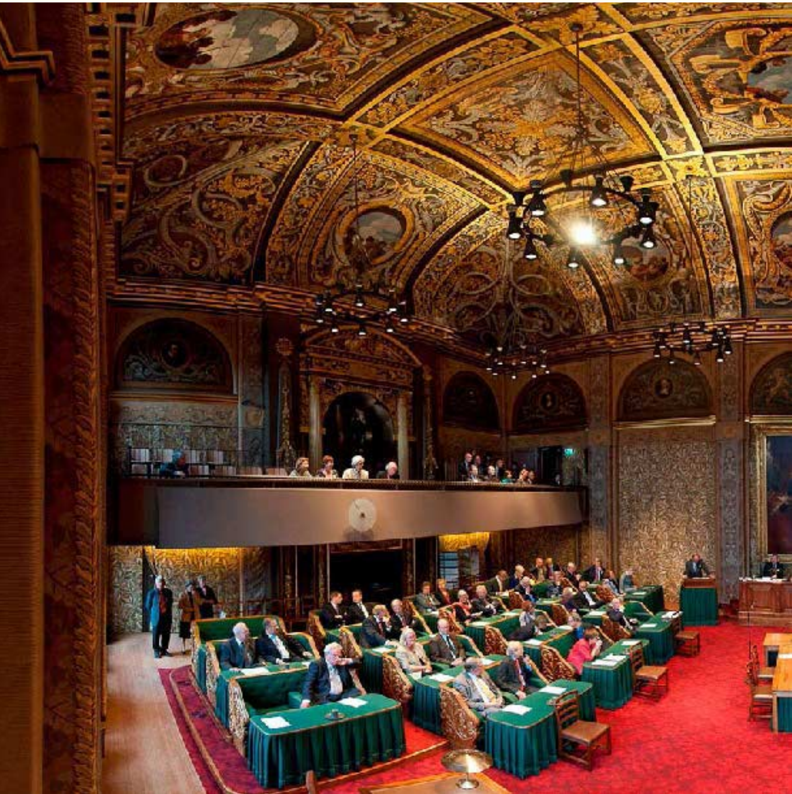
De Eerste Kamer