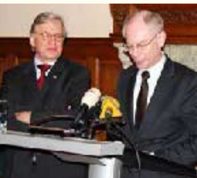
Links: Bezoek Voorzitter Europese Raad dhr. Van Rompuy