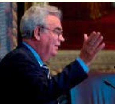
Dhr. Schuurman fractievoorzitter ChristenUnie

roepen te stimuleren dat het midden- en kleinbedrijf (MKB) volop en concurrerend kan participeren, door de in de wet genoemde projecten op de maatvoering van deze bedrijven aan te besteden, clustering tot een minimum te beperken en disproportionele eisen te voorkomen. 48 Ook werd de regering verzocht er bij het Interprovinciaal Overleg (IPO) en de Vereniging Nederlandse Gemeenten (VNG) op aan te dringen dat provincies en gemeenten in gelijke zin handelen. Tot slot werd de regering in een motie opgeroepen om te bevorderen dat bij de voorgestelde projecten die onder de Crisis- en herstelwet vallen al in de geest wordt gewerkt van het advies Sneller en Beter van de Commissie versnelling besluitvorming infrastructurele projecten ('Commissie Elverding'). 49