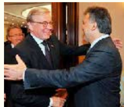
Rechts Bezoek Voorzitter Eerste Kamer aan de President van Turkije dhr. Gül

Op uitnodiging van de Voorzitter van de Turkse Grand National Assembly, de heer Şahin, heeft de Voorzitter van de Eerste Kamer in april 2010 een bezoek gebracht aan Turkije. Met zijn opvolger als Voorzitter van de Parlementaire Assemblée van de Raad van Europa, de Turk de heer Çavuşoğlu, besprak de Senaatsvoorzitter onder meer het belang van parlementaire diplomatie in een snel veranderende wereld en het belang van een sterke afvaardiging van nationale parlementariërs naar internationale parlementaire assemblees. In een gesprek met parlamentsvoorzitter Şahin kwamen behalve Europese en internationale vraagstukken ook de betrekkingen tussen Turkije en Nederland aan de orde. Met name het naderende jubileum van 400 jaar diplomatieke betrekkingen tussen Turkije en Nederland in 2012 kreeg aandacht. Met President Gül besprak de Kamervoorzitter de voortgang in de onderhandelingen over de toetreding van Turkije tot de Europese Unie, de verhouding van Turkije tot de landen in de regio (waaronder Rusland, Georgië, Armenië, Irak, Iran en Syrië), de betrekkingen tussen Turkije en Nederland en de grondwetswijziging die in Turkije op dat moment in behandeling was. De Senaatsvoorzitter merkte op dat een succesvolle afronding van het hervormingsproces een voorwaarde is voor de toetreding van Turkije tot de Europese Unie. Bijzondere aandacht is in de gesprekken ook besteed aan de positie van de vrouw in Turkije.