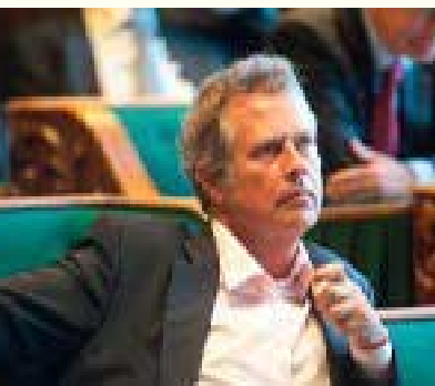
Dhr. Noten fractievoorzitter PvdA

van de Staten-Generaal zou leiden. Zij gaven aan dat Raadsdocumenten essentieel zijn om de wijzigingen in aanhangige voorstellen te volgen en het standpunt van de Nederlandse regering te beïnvloeden, en dat het de commissie enkel te doen is om Raadsdocumenten met betrekking tot geselecteerde dossiers. De minister sprak de bereidheid uit om meer informatie met de Kamer te gaan delen. 26 Over de wijze waarop hij dat wil gaan doen, heeft de minister vervolgens per brief aan de commissie geantwoord. 27