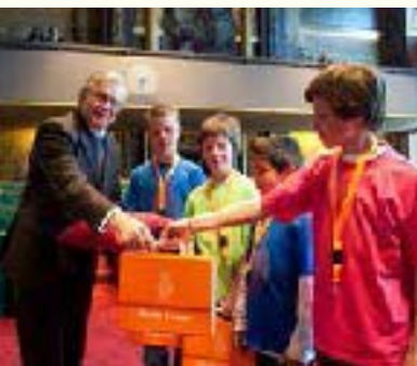
Aanbieding vernieuwde leskoffer Derde Kamer