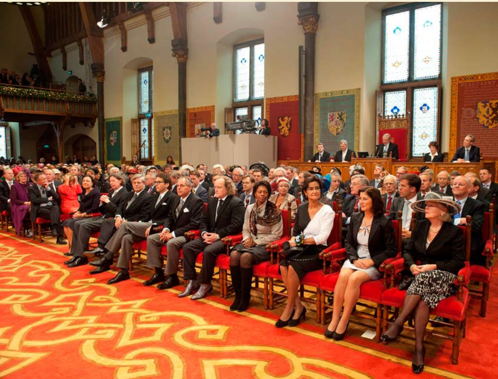
Verenigde Vergadering in Ridderzaal op Prinsjesdag