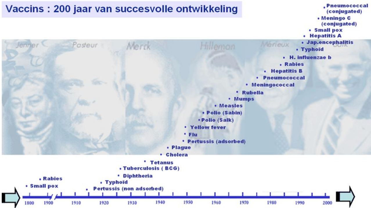
Figuur van Bron SP-MSD

met de smetstof uit een koepokzweer van deze melkmeisjes. Inderdaad bleken zij daarna immuun voor het menselijke pokkenvirus. En zo was de eerste vaccinatie een feit.