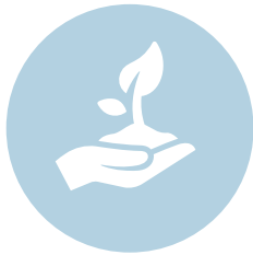
Klimaatverandering en milieu