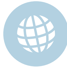
Rol van de EU in de wereld