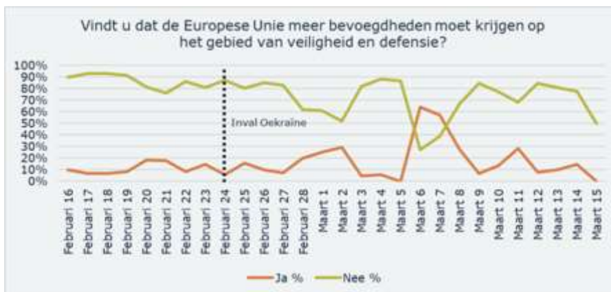
Figuur 2: ja/nee respons op vraag 5 geanalyseerd in een tijdlijn

Op basis van de reacties op vraag 5 is in een tijdlijn in kaart gebracht hoe de ja/nee respons zich heeft ontwikkeld. Dit om na te gaan of er een verschil in reacties is na de inval van Rusland in Oekraïne. Op basis van deze consultatie is geen duidelijk verband gevonden tussen de Russische invasie in Oekraïne en de opinie over Europese defensie- en veiligheidssamenwerking. Dit kan te maken hebben met het feit dat er veel meer reacties binnen zijn gekomen vóór het uitbreken van het conflict in Oekraïne dan daarna.