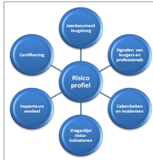
Figuur 2: risicomodel

De inspectie houdt risicogebaseerd toezicht . Dit houdt in dat zij toezicht uitvoert op die plaatsen waar volgens haar inschatting de risico's van onveiligheid en/of kwaliteitstekorten voor jongeren het grootst zijn. Die inschatting maakt de inspectie op basis van zowel interne als externe informatie, waarbij ook het professionele oordeel van de inspecteurs een belangrijke rol speelt.