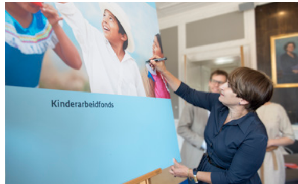
Minister Ploumen ondertekent Fonds Bestrijding Kinderarbeid

De ambassade in Turkije zette in 2016 de samenwerking voor een meerjarig project tegen kindarbeid in de Turkse hazelnootsector voort met de International Labour Organisation (ILO), Turkse nationale en decentrale overheden en CAOBISCO, de brancheorganisatie voor de hazelnoot verwerkende industrie. Tot najaar 2016 zijn ruim drieduizend kinderen bereikt met dit project. De meerderheid hiervan gaat nu wel naar school in plaats van werken in de hazelnootsector.