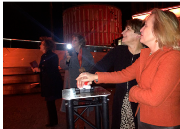
Minister Ploumen en minister Bussemaker tijdens de VN-campagne 16 days against violence against women