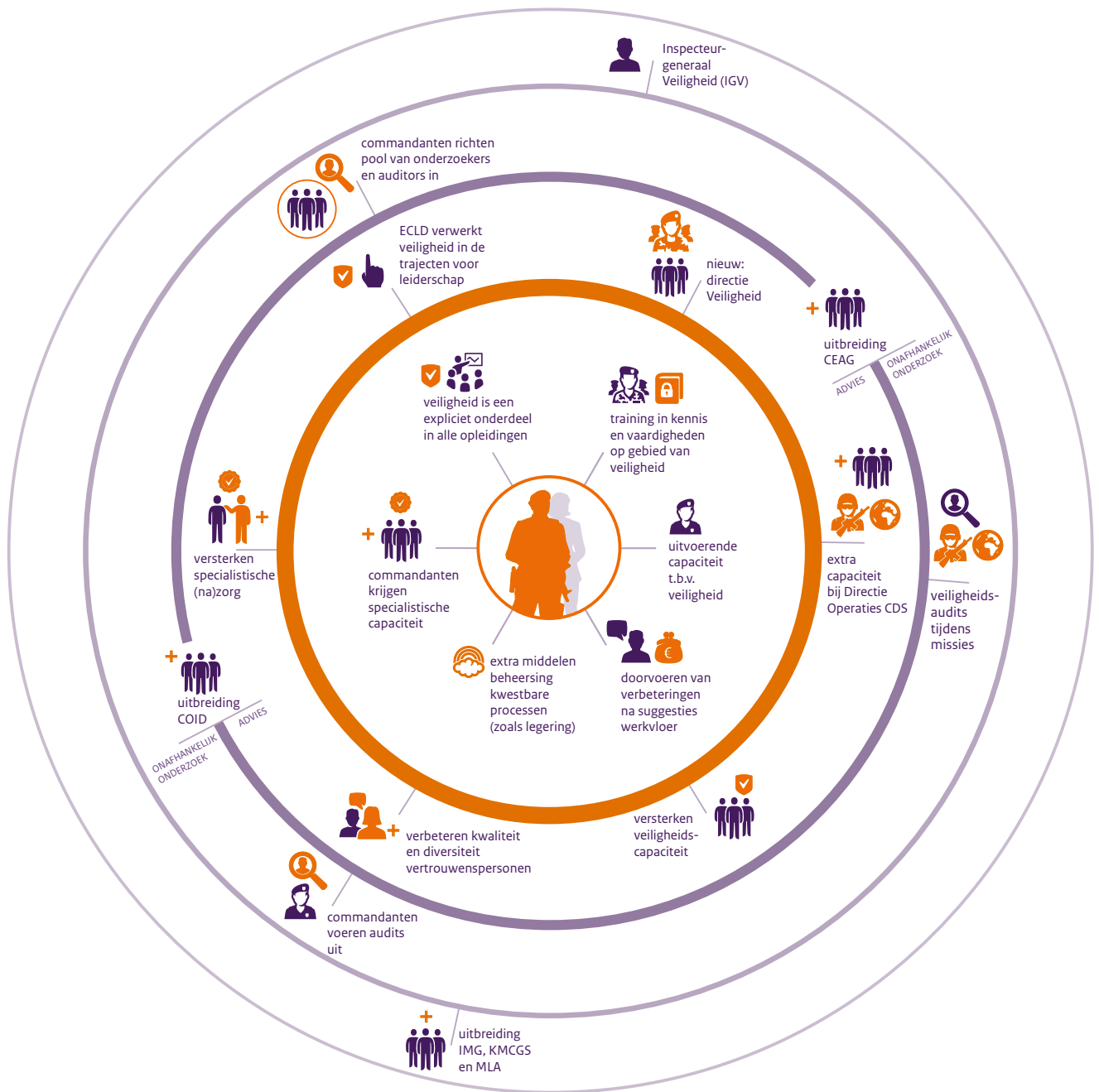
Vier lijnen van verdediging voor risicobeheersing in organisaties