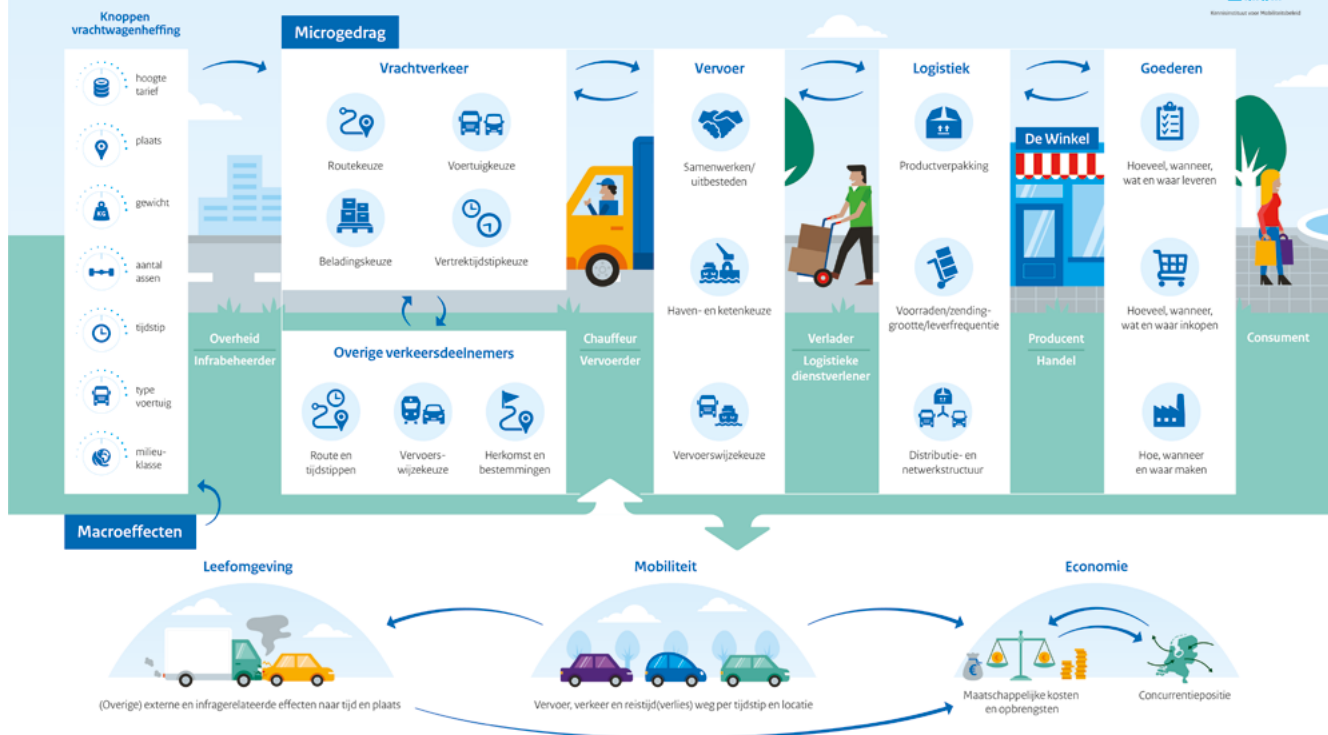
Figuur 2.1 Conceptueel denkkader voor de doorwerking van de effecten van een vrachtwagenheffing.

Aan de bovenkant in het model staan de vier markten/lagen afgebeeld waarin (verschillende) actoren met elkaar interacteren (grijs gearceerd): verkeer, vervoer, logistiek en goederen. Onderhandelingen en afspraken over prijs (p), kwaliteit en leveringsvoorwaarden (p & q) en hoeveelheid (q) vinden plaats op deze markten.