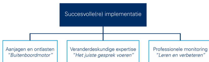
Figuur 3: Mechanismen: de bijdrage van de adviesbureaus aan de implementatie van de projecten van de verpleeghuizen.