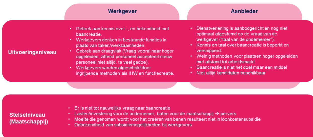
Figuur 2: Knelpunten die aanbieders van baancreatie ervaren