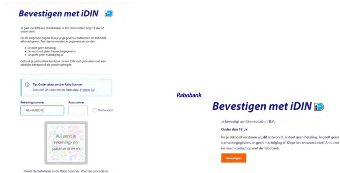
Figuur 2: Leeftijd bevestigen met iDIN.

Vervolgens ziet de klant in de mijn-omgeving van Drankdozijn.nl dat zijn/haar leeftijd is gecontroleerd (54).