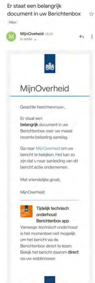
Figuur 1. Voorbeeld van een recente DigiD phishing e-mail.

Mitigerende maatregel: De waarschijnlijkheid van deze aanval is erg laag in het geval van alcohol verkoop, waardoor een mitigerende maatregel uit verhouding is. Daarnaast is het verkleinen van de kans op fraude door middel van phishing e-mails lastig. Maatregelen focussen zich op gebruikers bekend maken met het bestaan en