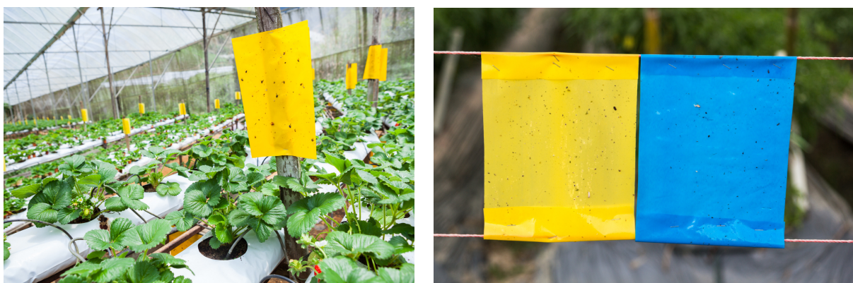
Afbeelding 5: lijmvalen in een kas met aardbeien (links) en lijmvalen in de akkerbouw (rechts).

Daarnaast zijn er lijmrollen en lijmlinten die worden gebruikt door particulieren of agrariërs en bevatten mottenpotten soms ook lijmvelen aan de binnenkant. Er zijn ook dazenvallen waarbij lijm wordt toegepast, zie ook het overzicht van lijmproducten die te koop zijn. In de glastuinbouw en akkerbouw worden lijmvalen gebruikt voor het monitoren van vliegende insecten (zowel plaagsoorten als natuurlijke vijanden van die soorten). De lijmplaten hangen boven of tussen het gewas, zodat vliegende insecten erop landen voordat zij het gewas bereiken of er actief naartoe vliegen vanuit het gewas.