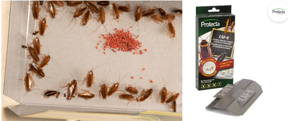
Afbeelding 3a en 3b: kakkerlakken op een lijmplaat met lokaas (links) en een screenshot (30-11-2023) van een Protecta tunnelval voor kakkerlakken (rechts, bron: allestegenongedierte.nl).

Waar lijmplaten regelmatig voor worden ingezet is de monitoring van kakkerlakken. Door de vallen kundig te plaatsen kan in kaart worden gebracht op welke plekken in een pand er hoeveel insecten zijn. De bron van de overlast kan zo worden opgespoord, waarna er een gerichte bestrijding kan plaatvinden met mechanische of chemische middelen.