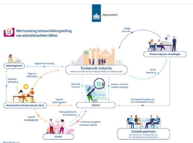
Figuur 2. Praatplaat Wtta

Al met al is het dan ook niet verwonderlijk dat in de vraag van de opdrachtgever aan een potentiële uitvoerder van de Wtta het accent vooral ligt op het opnemen van een organisatie onderdeel dat samenhangende taken uitvoert.