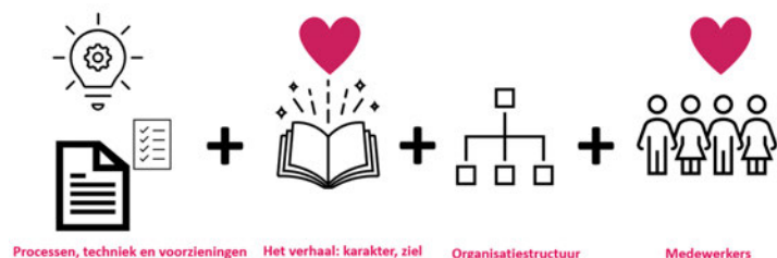
Figuur 1b. Onderdelen van de basisinrichting

Het kwartiermakersteam hanteert het motto "plug and play", dat geeft aan dat de basisinrichting zowel zelfstandig kan bestaan als 'ingepugged' kan worden bij een bestaande organisatie. Daarmee is de aanpak gericht op de toestandbrenging van een TI als totaalpakket inclusief de contacten met externe relevante partijen, zoals inspectie-instellingen. De keuze voor deze aanpak vloeit voort uit: