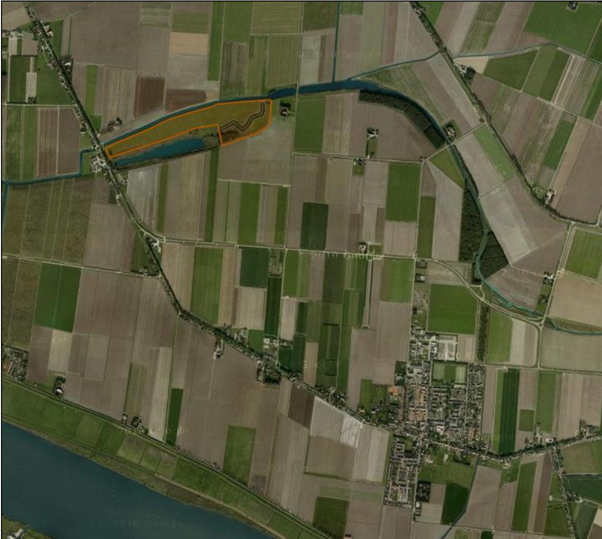
Figuur 2: Ligging Beschermd natuurmonument Groote Gat (detail).