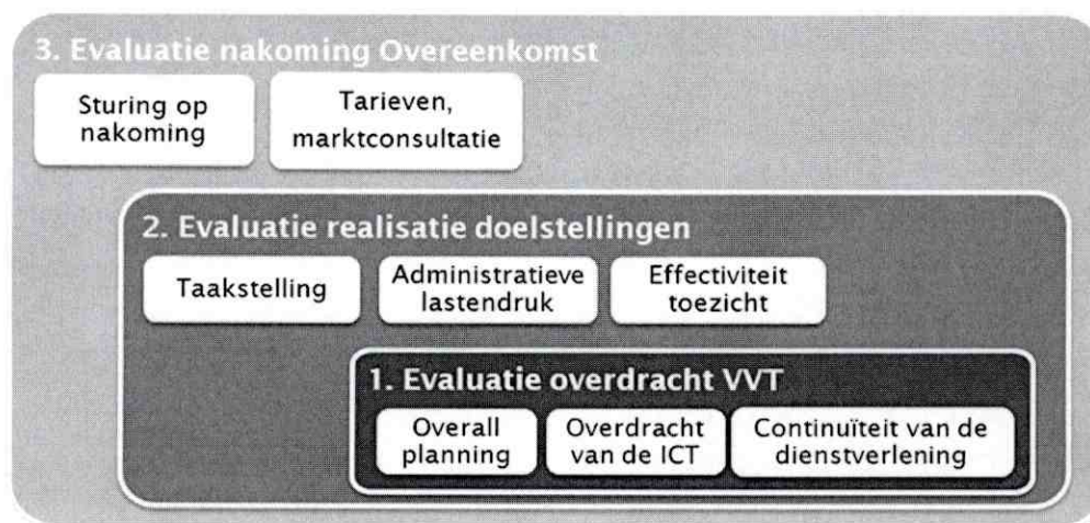
Figuur 1: Onderzoeksbenadering Evaluatie overdracht vergunningverlenende taken

Ten einde een zo compleet mogelijke weergave te presenteren van de overdracht van vergunningverlenende taken van IVW naar Kiwa wordt vanuit drie invalshoeken geëvalueerd. Deze invalshoeken zijn in onderstaande figuur gevisualiseerd.