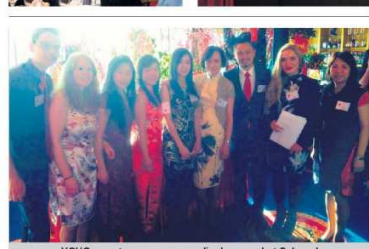
VCHO wenst u een voorspoedig Jaar van het Schaaap! 中 會 公 會 祝 大 家 羊 年 快 樂 ， 吉 祥 如 意 ！