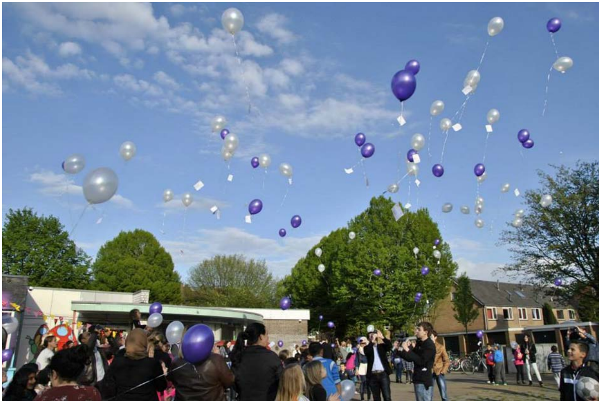
Figuur 1.1 Opening van De Witte Vlinder

De Gemeente (door het beschikbaar stellen van een gebouw), de provincie (subsidie van €170.000 voor fysieke aanpassingen van het gebouw, waaronder het dak), de Koninklijke Nederlandse Hei- demaatschappij (lening van €50.000), het Oranjefonds en GAMMA (voor het aanleggen van de vlin- dertuin). Er is geen startkapitaal van het LSA.