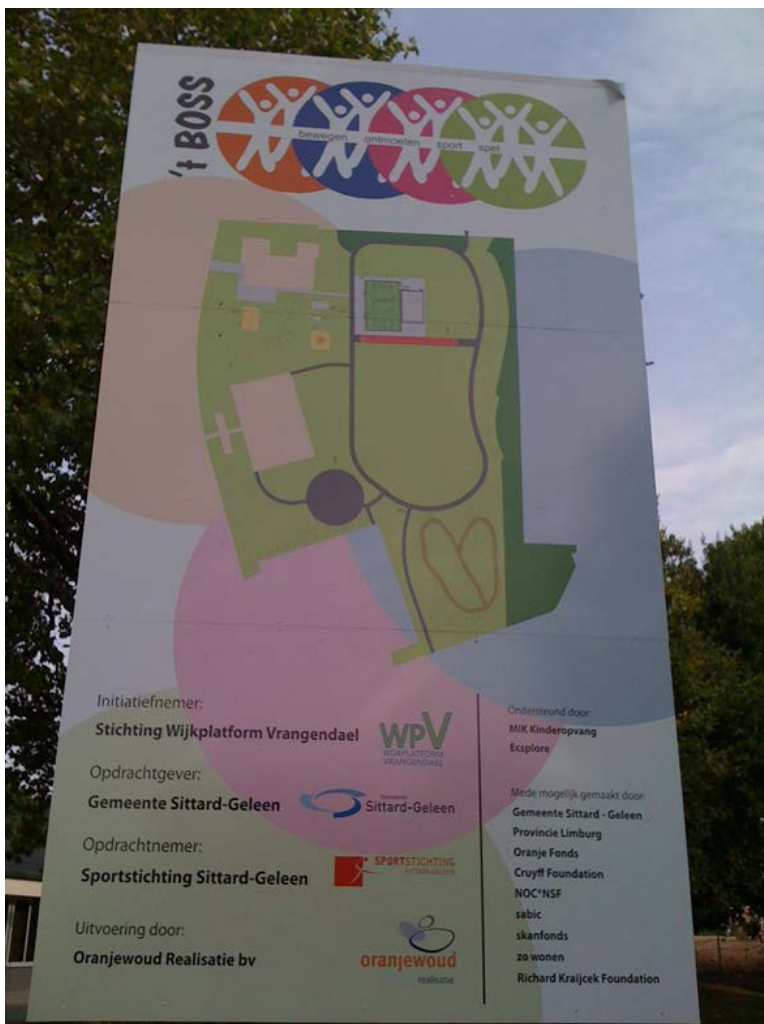
Figuur 1.8 Het plan voor het BOSS park.

Na de projectperiode (2010-2013) dient de organisatie ingebed te worden in een bewonersorganisatie die het beheer, het onderhoud en de exploitatie van het park gaat uitvoeren. Daartoe is de stichting het BOSS park in december 2013 opgericht. De projectperiode is echter nog met vier jaar verlengd en in 2014 is de statusquo gehandhaafd, wat betekent dat de sportstichting nog het beheer en onderhoud uitvoert. Doorontwikkeling naar een bewonersbedrijf heeft aan het einde van de onderzoeksperiode nog niet plaatsgevonden.