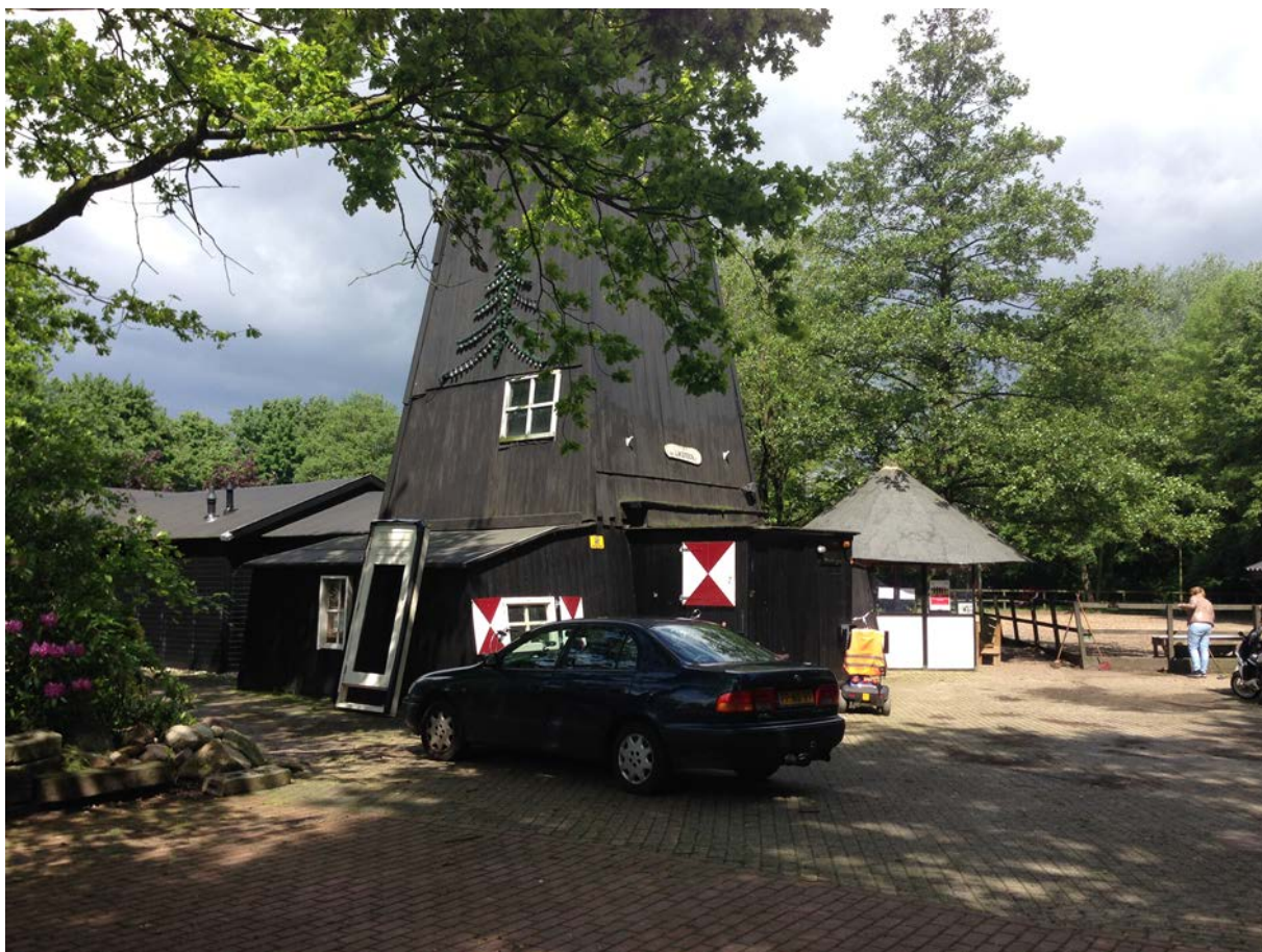
Figuur 1.5 't Geerdink

De directe aanleiding om een bewonersbedrijf op te richten zijn de bezuinigingen van gemeente, en in het bijzonder de bezuiniging op begeleidingskosten van werkervaringsplaatsen, waardoor eind 2012 de op dat moment grootste inkomstenbron voor de stichting wegvalt. Daardoor konden twee personeelsleden niet langer worden aangehouden. Door de verminderde beschikbaarheid van mensen voor werkervaringstrajecten kan de stichting ook minder opdrachten uitvoeren voor de gemeente en de woningcorporatie. De stichting verkeert daardoor inmiddels in financiële problemen.