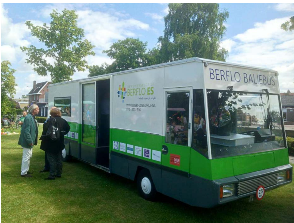
Figuur 7.2 De Berflo Baliebus

Berflo Baliebus is een SRV-wagen die is omgebouwd tot een mobiele ontmoetingsruimte en die op vaste dagen en tijdstippen door de wijk rijdt. In de Baliebus kunnen buurtbewoners terecht voor hulp, ondersteuning en informatie, maar ze kunnen zich ook melden als vrijwilliger voor enkele andere projecten (zie hieronder) van het bewonersbedrijf. Indien nodig worden bewoners met hun vraag of probleem doorverwezen naar deskundigen of instantie(s).