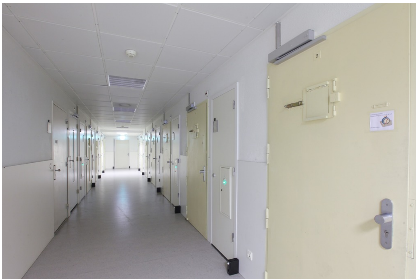
Afbeelding 17. Het aantal jongeren in de JJI's is fors gedaald.

Vanaf de start van de doorlichtingen van de JJI's is er een aantal ingrijpende ontwikkelingen geweest. Zo is het aantal jongeren in de JJI's fors gedaald en de populatie veranderd. De jongeren die in JJI's verblijven zijn gemiddeld ouder bij binnenkomst. Die groep heeft zwaardere en langduriger bestaande problematiek. Daarnaast hebben organisatieveranderingen ook hun weerslag gehad op de bezetting en motivatie van het personeel en daarmee de kwaliteit van het primaire proces.