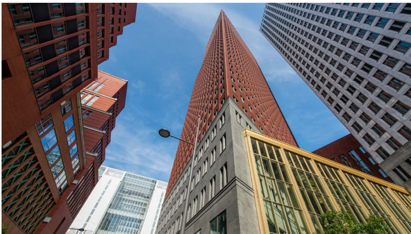
Afbeelding 21.

De Inspectie bestaat inmiddels vijf jaar. In die periode is het toezichtveld in de breedte toegenomen. Zo heeft de Inspectie in 2014 de verantwoordelijkheid gekregen voor het toezicht op de gehele vreemdelingenketen. In 2015, met de inwerkingtreding van de Jeugdwet, werd het toezicht uitgebreid met sanctietoepassing voor jeugdigen. De uitbreiding van taken betekende een uitdaging voor de Inspectie om die structureel geborgd te krijgen, kwalitatief en kwantitatief.