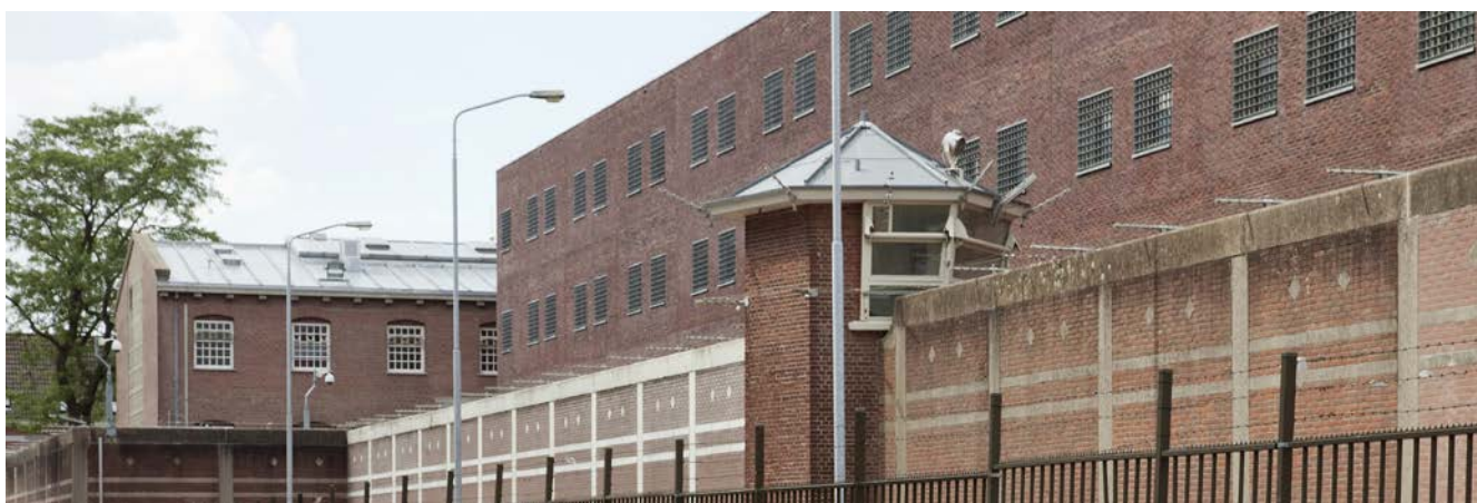
Afbeelding 15. Onderzoek toont aan dat de bezuinigingen in het gevangeniswezen niet leiden tot aantasting van het detentieklimaat of een toename van agressie.

De Inspectie heeft begin 2014 drie thema's benoemd die kunnen leiden tot risico's die samenhangen met deze taakstelling: het detentieklimaat, de agressiebeheersing en de maatschappelijke re-integratie. In 2015 heeft de Inspectie getoetst of deze aspecten van de sanctietoepassing, ondanks de genoemde veranderingen, nog