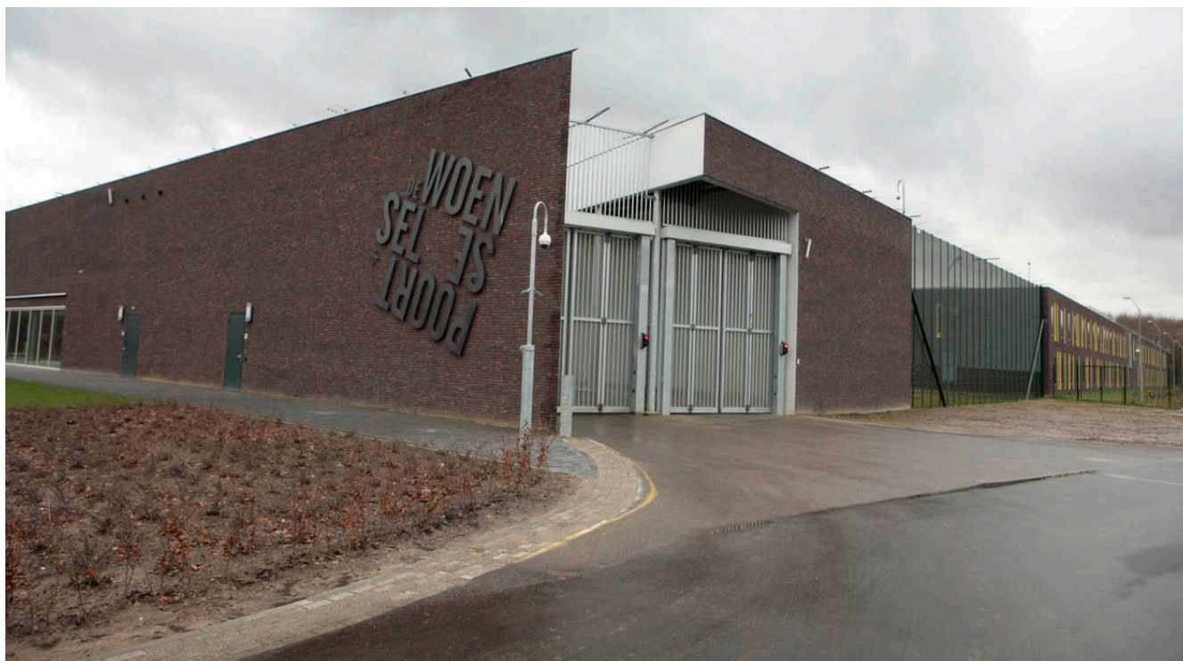
Afbeelding 13. PI De Woenselse Poort

Soms blijkt er na onderzoek meer aan de hand te zijn. Zoals bij de forensisch psychiatrische kliniek van De Woenselse Poort, waar de Inspectie in 2016 mede naar aanleiding van een melding over een dubbele zelfmoord en berichten in de media over onveiligheid, tekortkomingen op het gebied van de veiligheid constateerde. Zo bleek er sprake van gedoogd gebruik van softdrugs door cliënten, agressie en intimidatie onderling en naar medewerkers. De Inspectie concludeerde dat de kliniek onvoldoende toezicht had op haar cliënten als gevolg van tekortkomingen op het gebied van de personele bezetting, de managementstructuur en de cultuur. Naar aanleiding van de ernst van de bevindingen eiste de Inspectie een verbeterplan. In 2017 doet de Inspectie, in samenwerking met de IGZ, een vervolgonderzoek naar de ingezette verbetermaatregelen en de mogelijke effecten daarvan.