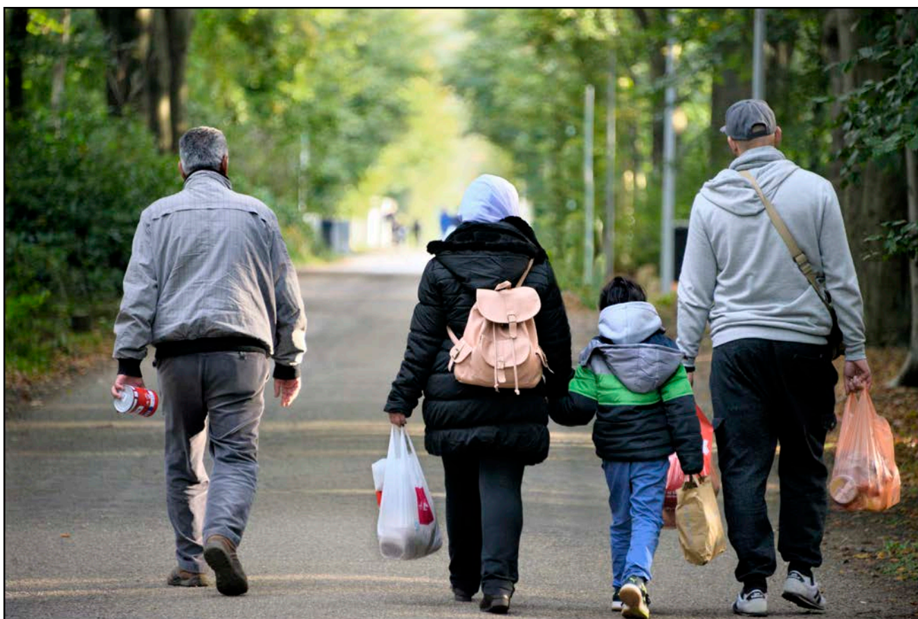
Afbeelding 6.

Eind 2016 is onderzoek gedaan naar de opvolging van signalen over mogelijke terroristische activiteiten. Uit onderzoek bleek dat binnen de politie, KMar, de IND en het COA, de meldstructuur om harde of zachte signalen door te geven aan de inlichtingen- en veiligheidsdiensten op orde is. Dit zijn signalen over de asielzoeker die van belang kunnen zijn voor de bestrijding van mensensmokkel, mensenhandel en terrorisme. De uitwisseling van zachte signalen en het lerend vermogen van de diensten onderling kan verder worden versterkt.