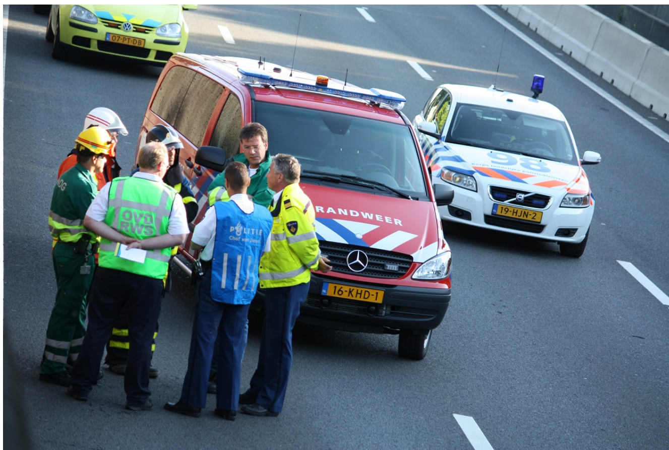
Afbeelding 1.

De Inspectie Veiligheid en Justitie (Inspectie) bestaat inmiddels vijf jaar. De afgelopen drie jaar heeft de Inspectie het toezicht gefocust op een aantal bepalende thema's: de invloed van bezuinigingen en reorganisaties, de kwaliteit van samenwerking in ketens en netwerken en informatieopslag en informatie-uitwisseling. Terugkijkend blijkt dit een juiste keuze. Uit het toezicht komt een aantal aandachtspunten naar voren voor de toekomstige uitvoering van taken, die samenhangen met deze thema's: