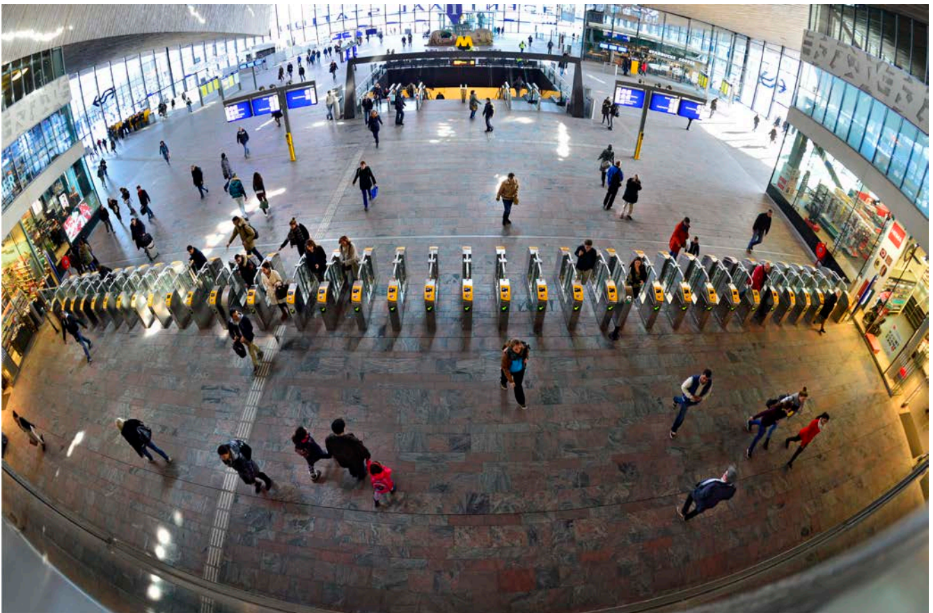
Afbeelding 2.