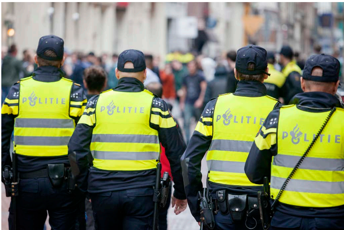
Afbeelding 9.

De Inspectie houdt toezicht op de taakuitvoering van, en de kwaliteitszorg door de politie. Daarbij kijkt de Inspectie ook naar de kwaliteit van het politieonderwijs en hoe de politie functioneert als partner in bijvoorbeeld de strafrechtketen en de vreemdelingenketen. Hiernaast rapporteert de Inspectie sinds de start van de reorganisatie van de politie periodiek over de voortgang van de vorming van de nationale politie. In 2017 publiceert de Inspectie een afsluitend rapport over de vorming van de nationale politie.