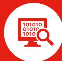
Ongewenste buitenlandse inmenging en ondermijning