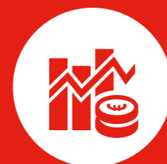
Bedreiging van vitale economische processen