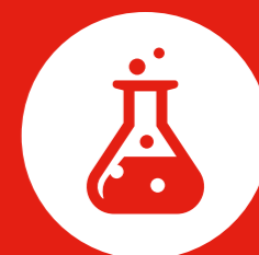
Dreiging van chemische, biologische, radiologische en nucleaire middelen (CBRN)