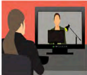
Interviews - Week 43 - 44