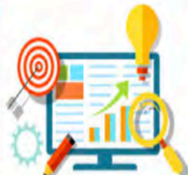
Analyseren IV/IT - Week 43 - 47