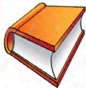
Opleveren advies rapport - Week 48/49

Documentatie onderzoek voor beeldvorming van