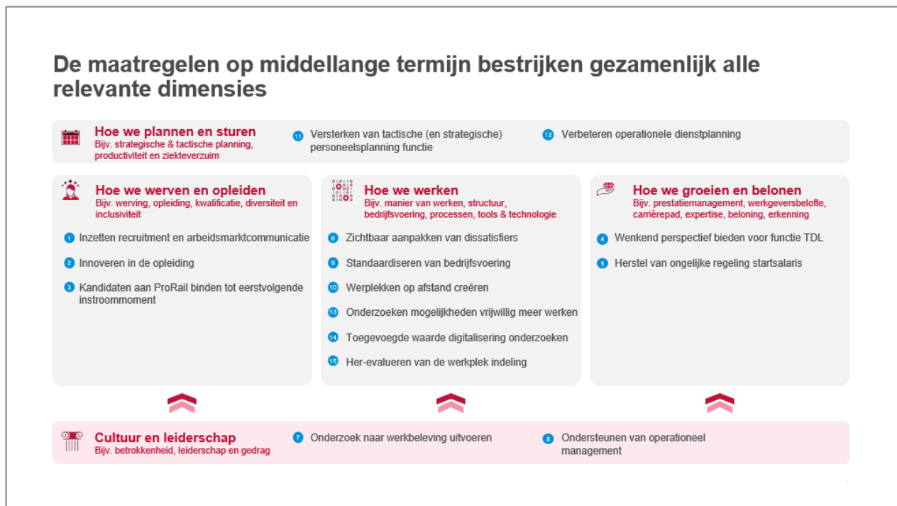
Figuur: voorgestelde maatregelen bestrijken alle relevante dimensies die wij op basis van onze ervaring zouden verwachten

Het aangescherpte plan van aanpak bevat maatregelen die op de middellange-termijn alle relevante dimensies bestrijken die wij op basis van onze ervaring zouden verwachten bij een dergelijk (operationeel) personeelstekort: planning, werving, opleiding, inzetbaarheid, groei, beloning en cultuur/werkbeleving.