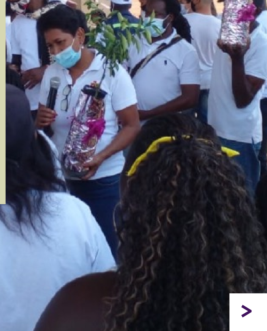
Deelname van partnerorganisatie aan een herdenkingsceremonie in het dorp Munchique, Colombia (2021)

In Colombia biedt Nederland financiële ondersteuning aan de Colombian Commission of Jurists (CCJ). De CCJ is een mensenrechtenorganisatie die bijdraagt aan de verbetering van veiligheids- en beschermingsmechanismen voor Colombiaanse mensenrechtenverdedigers (MRV's). Dit doen zij middels strategieontwikkeling voor procesvoering gericht op de bescherming en verdediging van land van boeren, inheemse volkeren en afro-gemeenschappen. Ook zorgt de organisatie voor meer zichtbaarheid van MRV's en sociale leiders op lokaal, nationaal en internationaal niveau en bevordert de CCJ de deelname van het maatschappelijk middenveld aan lokale en nationale instellingen die betrekking hebben op gerechtelijke vervolging, onderzoek naar en bestraffing van ernstige schendingen van MRV's. Zodoende draagt de organisatie bij aan versterking van de stem van MRV's in besluitvormingsprocessen van de Colombiaanse overheid en verbetering van het Colombiaanse rechtssysteem. Dit is van belang voor het tegengaan van mensenrechtenschendingen door bedrijfsactiviteiten.