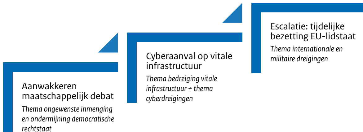
Figuur 12 Escalatieladder met de drie ‘hybride’ Rusland scenario’s in drie verschillende dreigingsthema’s

Te midden van spanningen tussen Rusland en Finland, waarbij Rusland middels verschillende kanalen de Europese bevolking ervan probeert te overtuigen dat Finse toetreding tot de NAVO een slecht idee is, wordt het maatschappelijke debat rondom vluchtelingen opnieuw aangewakkerd. In dit scenario faciliteert Rusland een grote vluchtelingenstroom richting de EU, waarbij push-backs aan zowel de zuidelijke als de oostelijke grenzen van Europa op grote schaal worden uitgelicht in de media. Het belangrijkste narratief dat Rusland poogt te laten aanslaan bij de bevolking van EU- en NAVO- lidstaten is dat de EU een incompetente en hypocriete institutie is, zonder enig bestaansrecht. Bovendien wordt een gestage troepenopbouw aan de westelijke grenzen van Rusland gesignaleerd. Er is onenigheid binnen de EU of dergelijke troepenopbouw een militaire reactie van de EU vereist (omdat Finland dus nog geen lid is van de NAVO), waarbij sommige lidstaten zelfs zover willen gaan artikel 42.7 in te roepen. Het belangrijkste effect dat Rusland in dit scenario zal beogen is het verdelen van de EU (en daarmee een groot deel van de lidstaten van de NAVO) en besluitvorming te beïnvloeden. Het is echter maar de vraag in hoeverre dergelijke verdeeldheid een structurele impact heeft op de besluitvorming van de EU (en de NAVO). Uiteindelijk leidt de troepenopbouw niet tot militaire acties van Rusland op EU/NAVO grondgebied, en lijkt de toegenomen spanning met een sissers af te lopen.