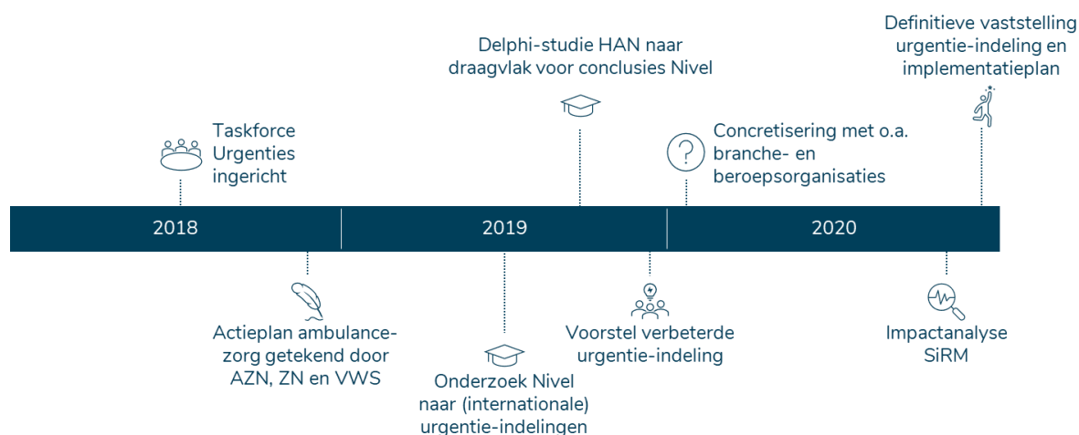
Figuur 1. Tijdslijn belangrijkste stappen die in de aanloop naar de verbeterde urgentie-indeling zijn genomen

In Figuur 1 staan de verschillende stappen weergegeven, die AZN gezet heeft in de aanloop naar de verbeterde urgentie-indeling.