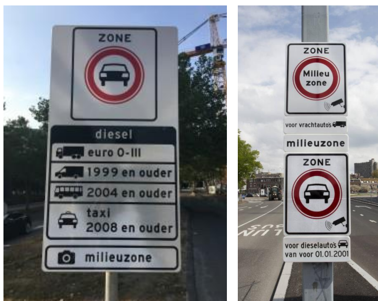
Figuur 1: Verkeersbord C6 en bijbehorende onderborden in Amsterdam (l) en Utrecht (r) vóór de harmonisatie

In 2006 is door gemeenten, bedrijfsleven en Rijk het “Convenant stimulering schone vrachtauto's en milieuzonering” ondertekend. In dit convenant zijn onder meer afspraken gemaakt over de milieueisen voor vrachtauto's in milieuzones, hantering van eenzelfde verkeersbord en regels voor ontheffingen. Naast milieuzones voor vrachtauto's zijn door verscheidene gemeenten de afgelopen jaren ook milieuzones ingesteld voor personen- en bedrijfsauto's 6 en/of autobussen. Deze gemeenten gebruikten voor de aanduiding van de milieuzone een ander verkeersbord (C6, gesloten voor motorvoertuigen op meer dan twee wielen) in combinatie met onderborden. Op deze onderborden werden de voertuigcategorie en het toegangsregime aangegeven. Consequentie was dat gemeenten verschillende toegangsregimes en verkeersborden hanteerden voor hun milieuzone.