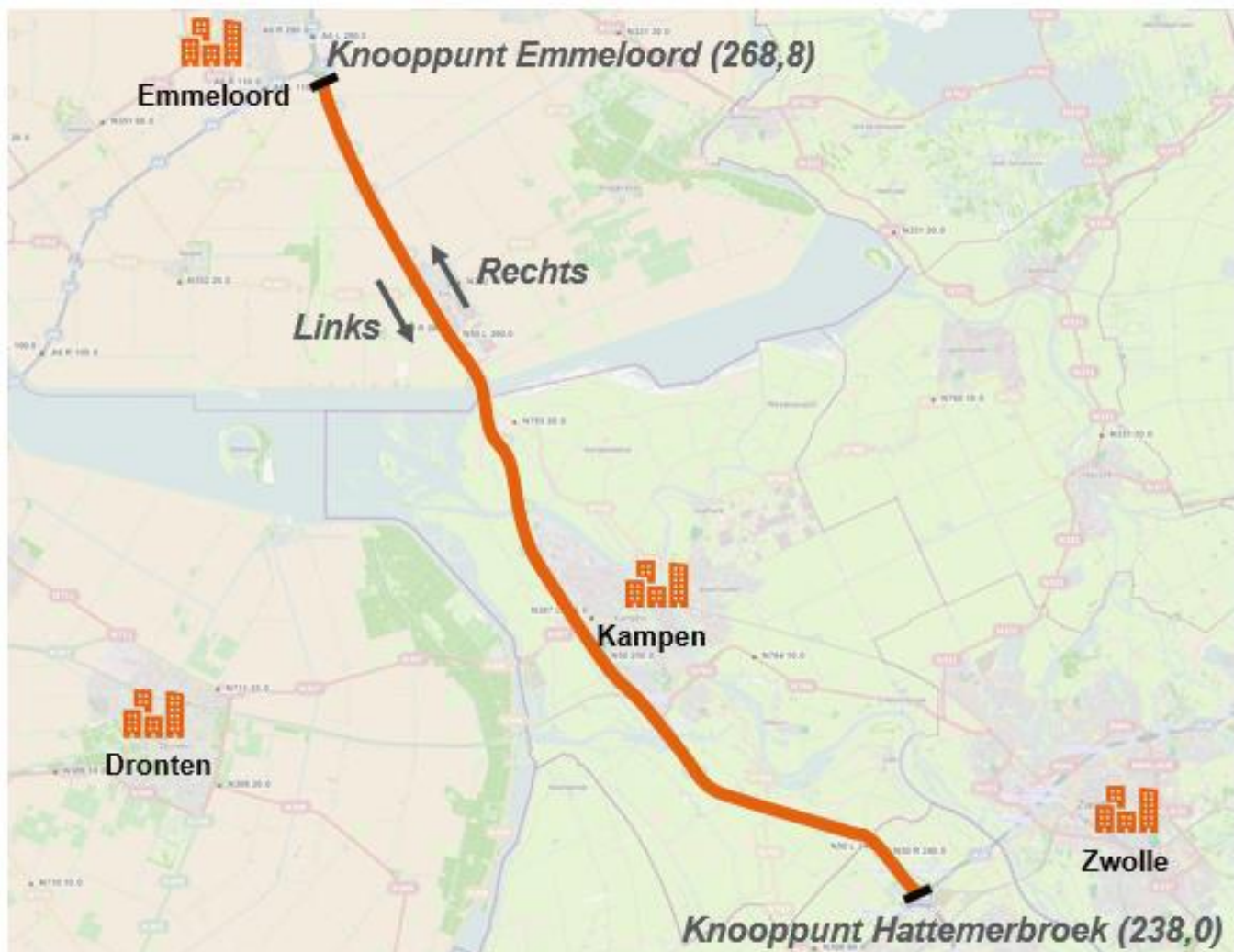
Figuur 1: Scope van de studie

Dit onderzoek richt zich op de hoofdrijbaan van de gehele N50, inclusief bijbehorende aansluitingen en kruisingen. De geografische scope van deze studie loopt vanaf knooppunt Hattermerbroek (hmp. 238,0) tot aan knooppunt Emmeloord (hmp. 268,8). De scope is weergegeven in Figuur 2. Op de plaatsen waar de rijbaan gescheiden is spreken we van rijrichting rechts voor de rijrichting vanaf knooppunt Hattermerbroek naar Emmeloord. De tegengestelde rijrichting vanaf knooppunt Emmeloord naar knooppunt Hattermerbroek betreft rijrichting links.