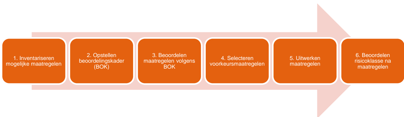
Figuur 2: Werkwijze om te komen tot maatregelen ter verbetering van verkeersveiligheid op N50

In de eerste fase van dit onderzoek zijn de verkeersveiligheidsrisico's op de N50 vastgesteld op basis van een inventarisatie van bestaande onderzoeken en wegkenmerken, een schouw en Human Factor analyse. In de Human Factor analyse is gekeken naar de relatie tussen de wegbeleving/gedrag, inrichting en ongevallen om een samenhangend beeld te krijgen van de verkeersveiligheidsrisico's. De resultaten zijn in samenhang beschouwd per deeltraject. Vervolgens is op basis van de risicomatrix van Rijkswaterstaat (RWS) per deeltraject een risicobeoordeling voor de huidige en autonome situatie vastgesteld. Vervolgens zijn op basis van de verkeersproblematiek op aansluitende deeltrajecten en de risicobeoordelingen verkeersveiligheidsproblemen voor de N50 als geheel geïnventariseerd. De geconstateerde verkeersveiligheidsrisico's en toegekende risicobeoordeling vormen de input voor de tweede fase van het onderzoek. De regionale partners hebben op verschillende momenten input kunnen leveren bij het onderzoek. In Figuur 2 is de werkwijze voor de tweede fase van het onderzoek weergegeven.