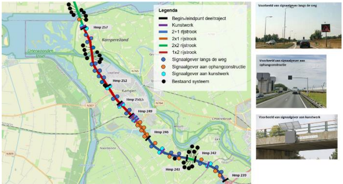
Figuur 5: Indicatie mogelijke locaties dynamisch filewaarschuwingssysteem