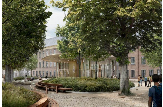
4. Publieksentree Tweede Kamer.