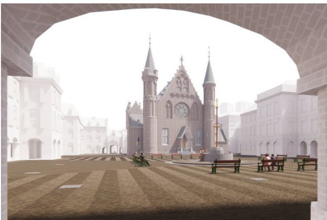
3. Concept ontwerp Opperhof. Beeld: Karres en Brands

In samenwerking met de architect van gebouwdeel TK wordt gewerkt aan het definitieve ontwerp voor de Hofplaats rondom de nieuwe publieksentree. Het ontwerp is een ensemble van nieuwe en bestaande bomen, groene eilanden met gevarieerde beplanting en zitelementen.