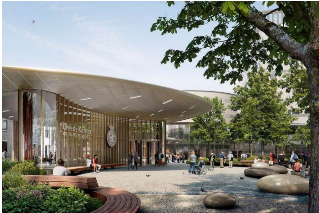
2. Publieksentree Tweede Kamer.

Zoals in de vorige rapportage aangegeven zal eind 2023 de voor de entree benodigde omgevingsvergunning worden aangevraagd. De omgevingsvergunningen van de bestaande gebouwdelen waren al aangevraagd. De vergunning voor de niet monumentale gebouwdelen is op 17 april 2023 afgegeven en die voor de monumentale gebouwdelen is 21 augustus 2023 verleend. Voor de laatste loopt de beroep- en bezwaartermijn tot begin oktober.