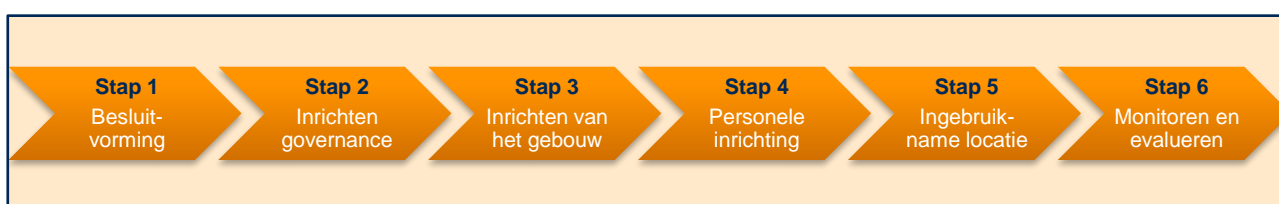
Figuur 4. Vervolgstappen in de richting van het implementatieplan

In figuur 4 hebben wij de vervolgstappen in de richting van het implementatieplan op hoofdlijnen geschetst. Daaronder geven we per vervolgstap een uitgebreidere beschrijving van de inhoudelijke punten die bij de verschillende vervolgstappen horen.