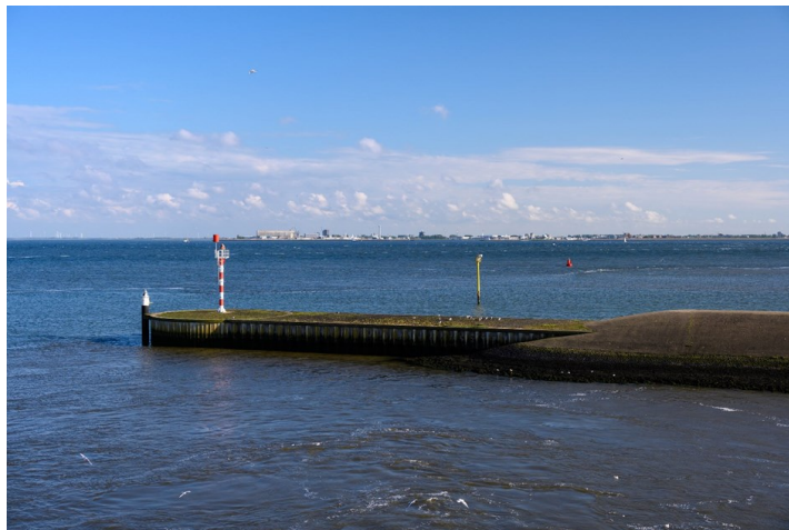
Afbeelding 4. Zicht op Den Helder vanaf Texel.

Op dit moment bestaat er een juridische lacune wanneer verstoring plaatsvindt zonder duidelijk veroorzaker; het Verdrag van Malta dekt die gevallen niet. Hollands Kroon stelt dat Den Haag deze leemte moet dichten en vervolgens onderzoek en maatregelen gefinancierd kunnen worden op basis van behoeftes. In het droomscenario beschikken Texel, Den Helder en Hollands Kroon gezamenlijk over een structureel budget—bijvoorbeeld een meerjarig fonds van gemeenten—om jaarlijks substantieel in veldonderzoek, beleid en ontheffingen te investeren. Wat betreft een structurele inbedding pleit Hollands Kroon voor een regionaal kernteam onder aanvoering van AWF, dat al korte lijnen onderhoudt met strandvinders, sportduikers en (maritieme) archeologen. Specialistische taken zoals monitoren en waarde-rend duikonderzoek blijven belegd bij experts, maar de gemeente wil samen met de AWF een stevige, gedeelde organisatorische basis leggen om het erfgoed systematisch te verkennen en beschermen.