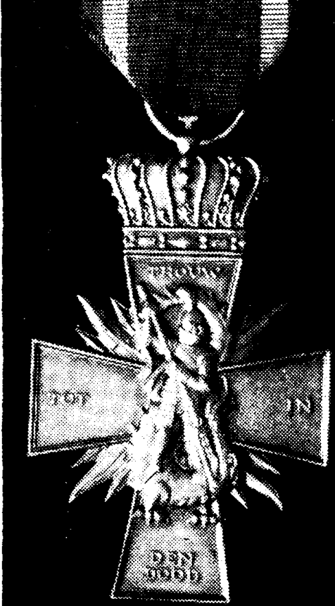
H.M. de Koningin heeft in het Paleis op den Dam aan ongeveer vijftig nabestaanden van in het verzet gevallen het Verzetkruis voor deze strijders postuum uitgereikt. Het kruis is in brons uitgevoerd en draagt het opschrift: „Trouw tot in den dood".

Ergens werd een vlag geheschen! Zie hoe onze blik verruimd is. Ieder van U weet nog van de mobilisatie in '39 't zinnetje: „Ergens in Nederland!" Nu bedoelen we met „ergens" hier of daar op de wereld-bol. Want weer zitten overal ter wereld jonge energieke kerels, Nederlanders! Jammer genoeg de meesten als militair, daar 't in 't Verre Oosten nog geen vrede is. Doch, hetzij als militair, hetzij als burger, zij laten de wereld zien, dat Nederland weer aan 't werk is, aan 't opbouwen, aan 't toonen dat wij niet gebroken zijn door den bezetter!